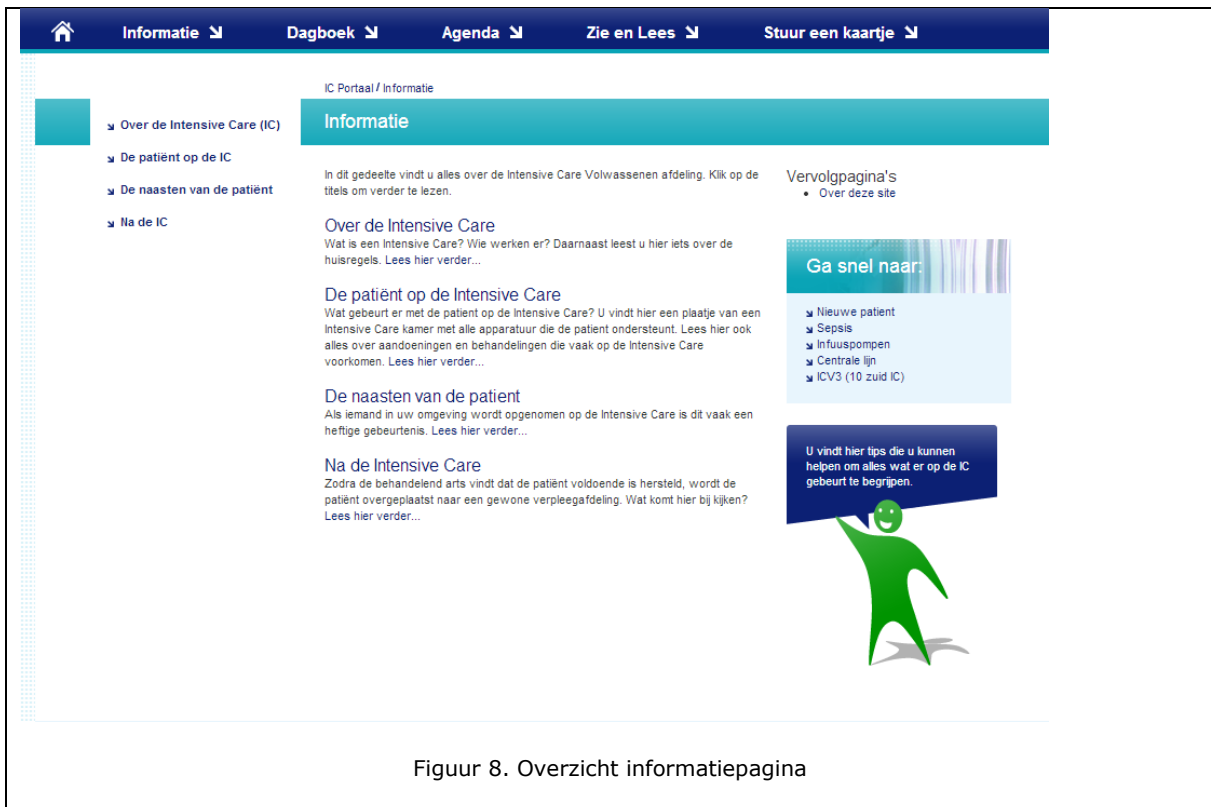
Figuur 8. Overzicht informatiepagina