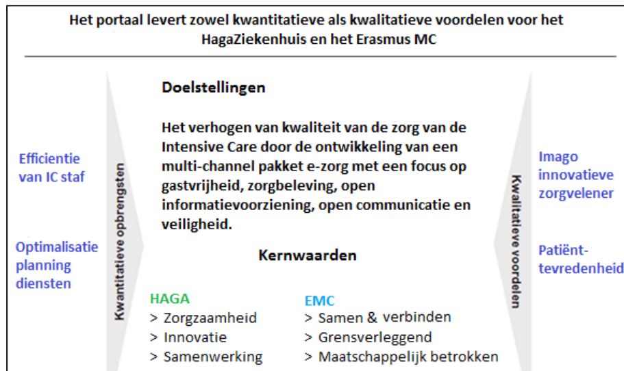
Figuur 1. Overzicht doelstellingen IC-Portaal