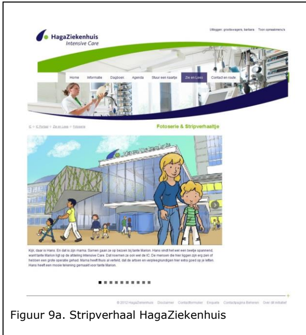
Figuur 9a. Stripverhaal HagaZiekenhuis